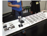
ピンセットこれくしょん