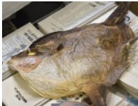
マンボウなんでも博物館

リアルな生きものフィギュアの展示や研究の発表など、生きものに関する「ナルホド!」や「しんはっけん!」が見つかるかも。